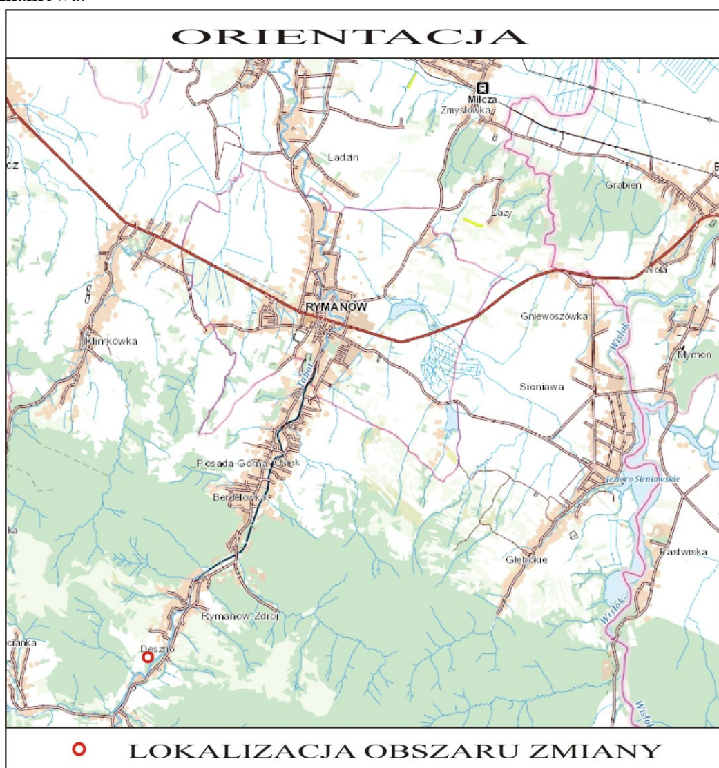
Rysunek 1. Lokalizacja obszaru objętego projektem zmiany planu.

Objęte projektem zmiany planu tereny są w przeważającej części niezabudowane i nieużytkowane rolniczo, okresowo koszone. Na terenach nr 2 i 4 znajduje się zabudowa mieszkaniowa.