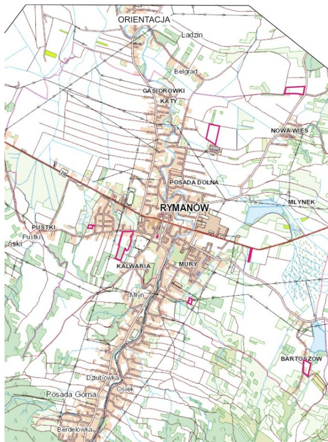
Rysunek 1. Lokalizacja obszarów objętych projektem zmiany Studium Uwarunkowań i Kierunków Zagospodarowania Przestrzennego Gminy Rymanów.

Geologia – W podziale geologicznym gmina Rymanów położona jest w obrębie Karpat Wschodnich, będących fragmentem łuku karpackiego, zwanych Karpatami fliszowymi. W budowie geologicznej dominują osady fliszowe, powstałe w okresie kredowo - paleogeńskim. Podłożem utworów fliszowych są osady paleozoiczno-mezozoiczne. Gmina Rymanów leży w obrębie tzw. fałdu Iwonicza – Rymanowa będącego pierwszym od południa fałdem centralnej depresji karpackiej. Najbardziej wyniesiona część fałdu, gdzie na powierzchni występują otwory eocenu środkowego i dolnego, aż do łupków pstrych włącznie znajdują się w rejonie Lubatówki na zachodzie poprzez Iwonicz - Zdrój, Klimkówkę, Rymanów Zdrój, aż do Rudawki Rymanowskiej na wschodzie. Tektonicznie fałd Iwonicza - Zdroju stanowi wyniesienie pocięte uskokami poprzecznymi na bloki o północnym skrzydle złuskowanym, a południowym, łagodniejszym i pełnym, ale wtórnie sfałdowanym na dnie drugorzędnej łuski.