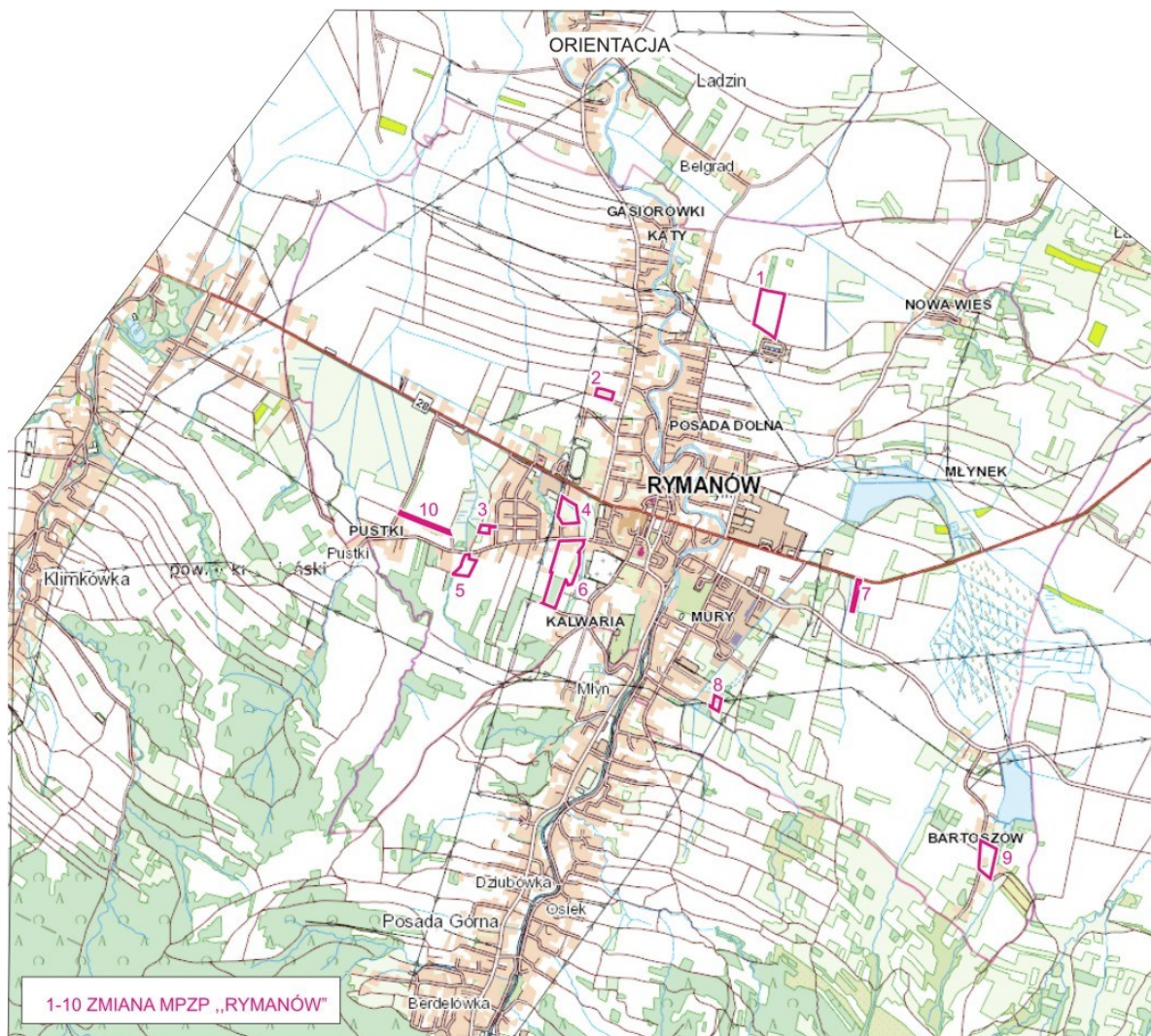
Rysunek 1. Lokalizacja obszarów objętych projektem zmiany planu.

Analizowane obszary położone są w dolinie potoku Morwawa i charakteryzują się mało urozmaiconą rzeźbą terenu.